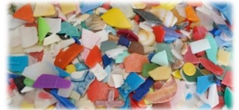
庄内海岸で回収したマイクロプラスチック (プラスチック破片ごみ)